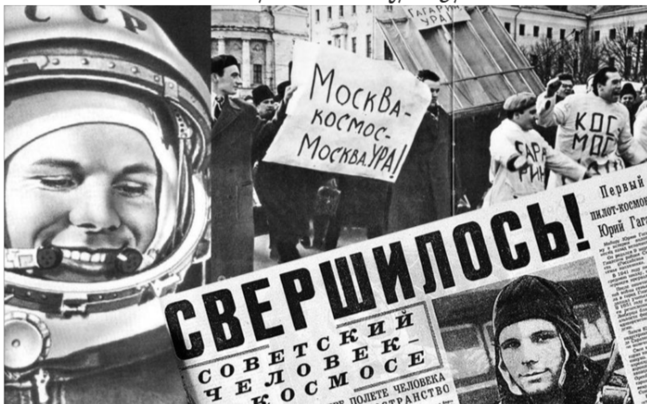
● Юрий Гагарин